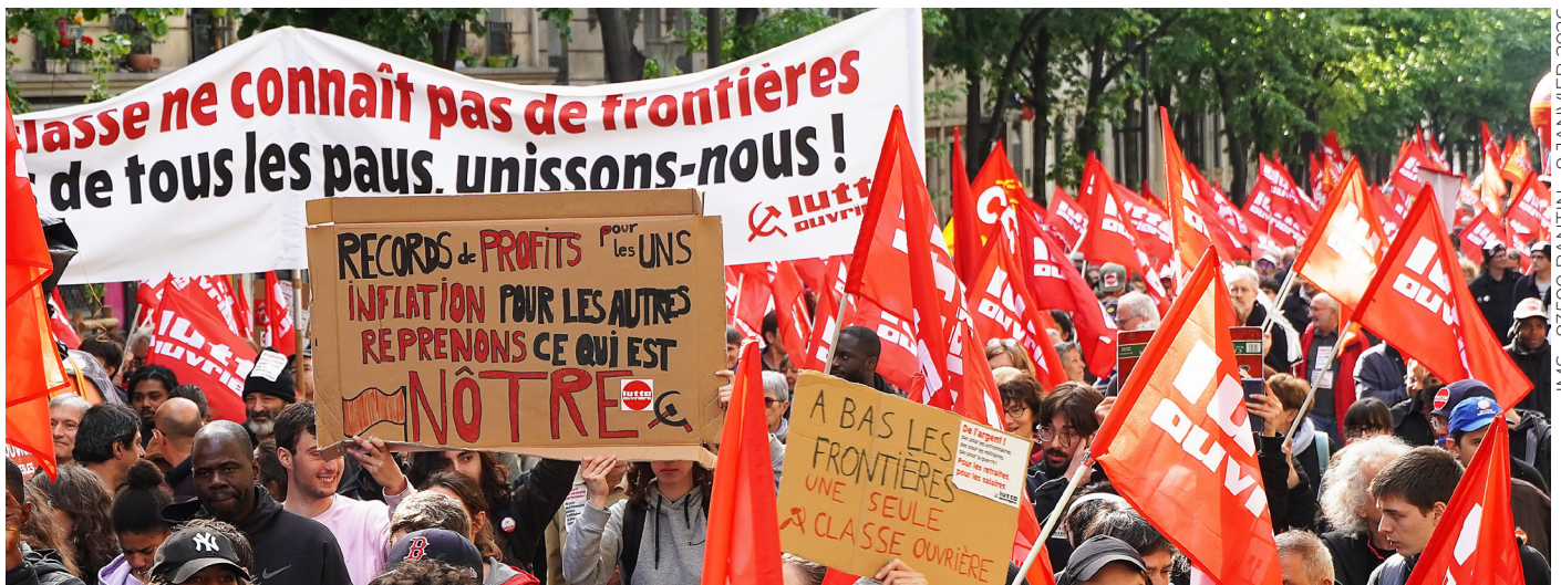
IMS - 93500 PANTIN - 9 JANVIER 2026